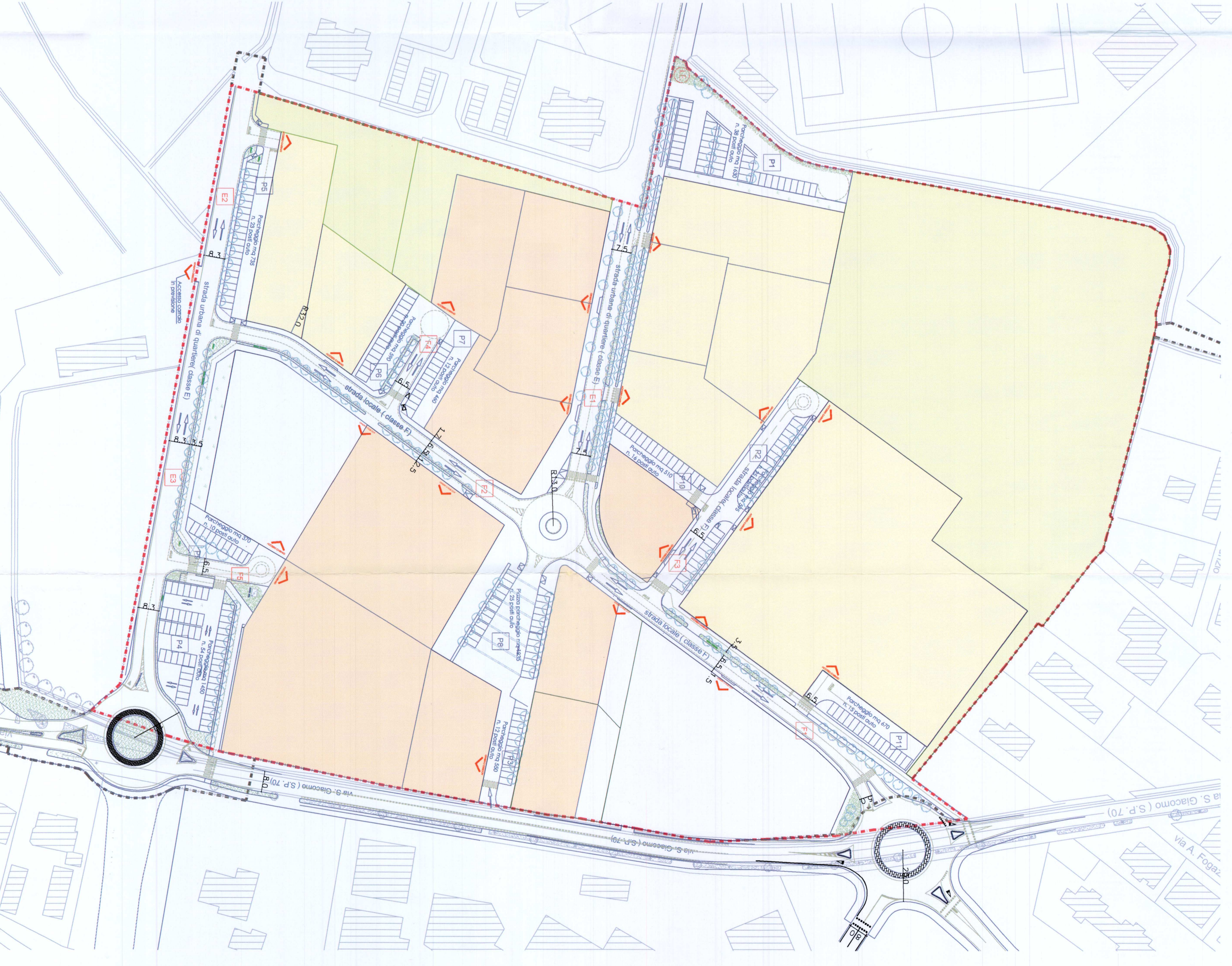
PLANIMETRIA 1:1000, IN VARIANTE Comune di Portogruaro n. 202/11351 del 27/04/2010. Nota Correlata 8/1/11 15:00 50/50/2011